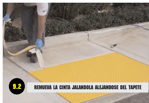
9.2 REMUEVA LA CINTA JALANDOLA ALEJANDOSE DEL TAPETE