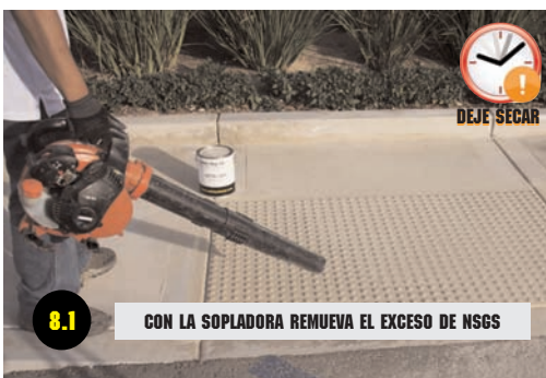
8.1 CON LA SOPLADORA REMUEVA EL EXCESO DE NSGS