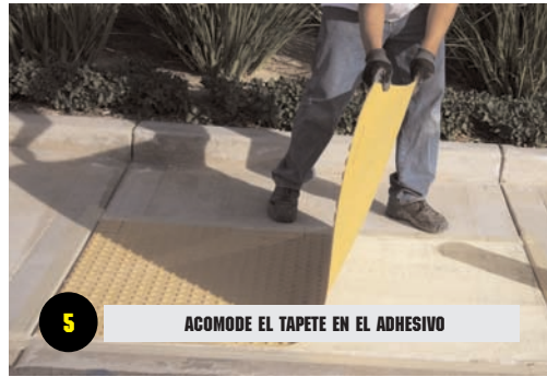
5 ACOMODE EL TAPETE EN EL ADHESIVO