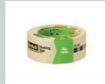
CINTA ADHESIVA DE 2"