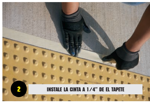
2 INSTALE LA CINTA A 1/4" DE EL TAPETE