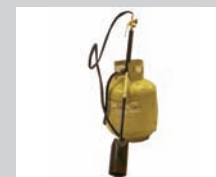
TANQUE DE GAS DE 20 LBS CON ANTORCHA PARA APLICACION EN CLIMA FRIJO