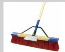
CEPILLO DE CERDA DURA