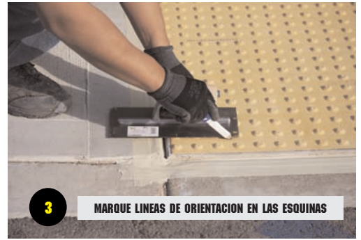
3 MARQUE LINEAS DE ORIENTACION EN LAS ESQUINAS