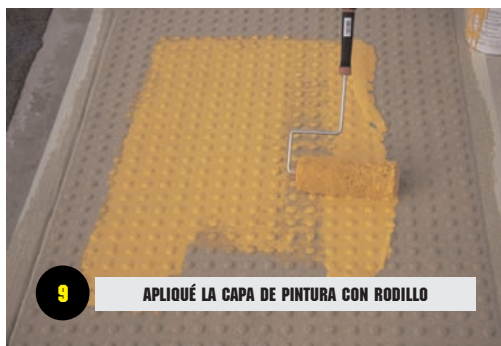
9 APLIQUE LA CAPA DE PINTURA CON RODILLO