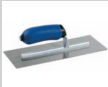
LLANA DE 1/8" O 3/16"