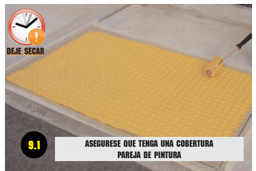
9.1 ASEGURESE QUE TENGA UNA COBERTURA PAREJA DE PINTURA