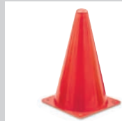
CONOS DE SEGURIDAD