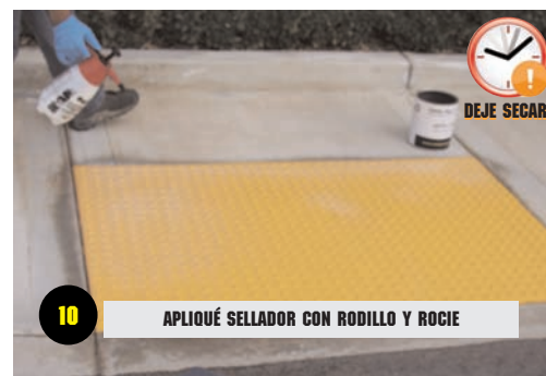
10 APLIQUE SELLADOR CON RODILLO Y ROCIE

Si tiene preguntas o necesita asistencia. Por favor llame a 1 866 SAFETYSTEPTD ( 1 866 723 3883) . Para preguntas tecnicas llame al 951 712 2939 www.safetysteptd.com