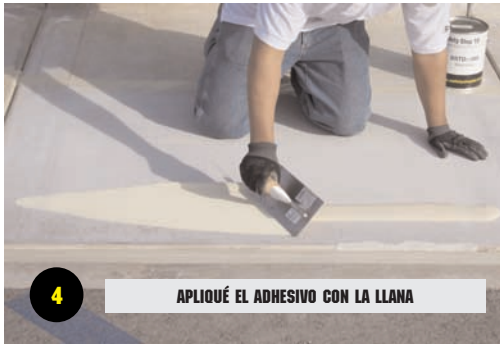
4 APLIQUE EL ADHESIVO CON LA LLANA