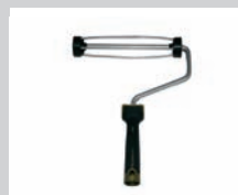
MANIJA PARA LOS RODILLOS