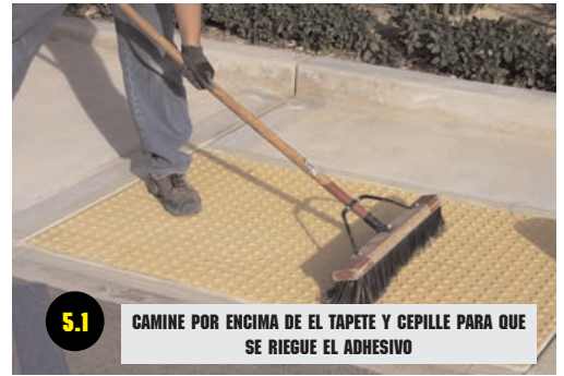
5.1 CAMINE POR ENCIMA DE EL TAPETE Y CEPILLE PARA QUE SE RIEGUE EL ADHESIVO