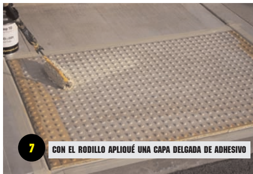
7 CON EL RODILLO APLIQUE UNA CAPA DELGADA DE ADHESIVO