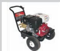
BOMBA DE AGUA A PRESION