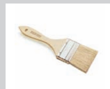
BROCHAS DE 3"