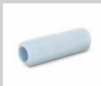
3 RODILLOS DE 3/4"