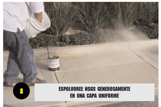
8 ESPOLVOREE NSGS GENEROSAMENTE EN UNA CAPA UNIFORME