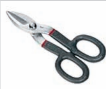
TIJERAS DE UTILERIA