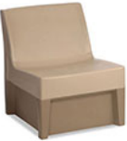
Forté Lounge Armless Chair - Molded Base