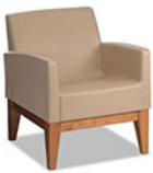
Forté Lounge Arm Chair - Wood Base