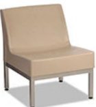
Forté Lounge Armless Chair - Steel Base