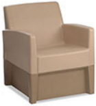
Forté Lounge Arm Chair - Molded Base