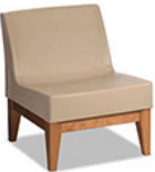
Forté Lounge Armless Chair - Wood Base