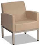
Forté Lounge Arm Chair - Steel Base